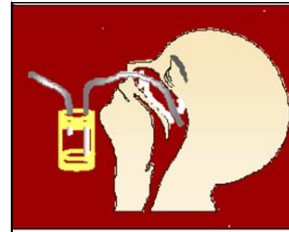
Figura 2: Coletor brônquico (bronquinho):